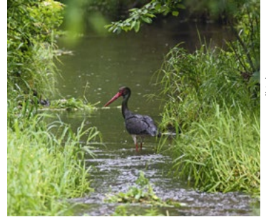
HessenForst, Forstamt Hofbieber