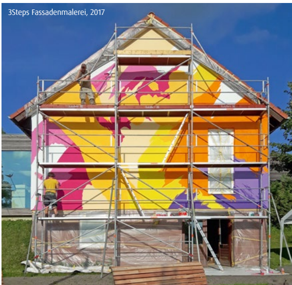
3Steps Fassadenmalerei, 2017

Kunst erleben und sehen, wie sie entsteht, mit Künstler*innen ins Gespräch kommen – das gehört zum Programm der Kunststation dazu. Immer wieder werden Künstler*innen eingeladen, um nicht nur auszustellen, sondern auch vor Ort zu arbeiten. So können Kunstinteressierte und Kunstschaffende einander begegnen, sich austauschen und gegenseitig inspirieren.