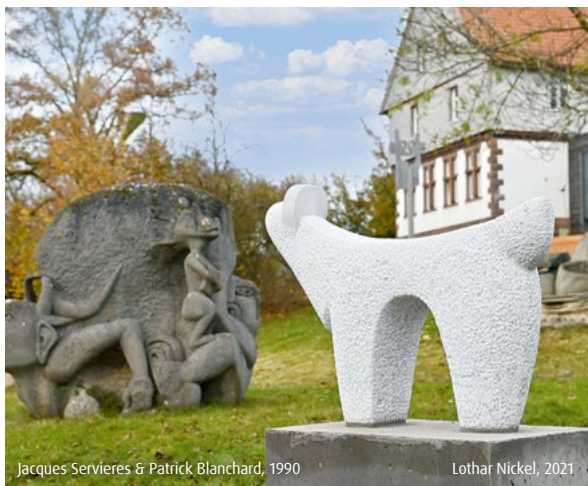
Jacques Servieres & Patrick Blanchard, 1990

Kunst im Freien können Sie jederzeit genießen: Die im offenen Skulpturengarten vor der Kunststation befindlichen Werke aus Holz, Stein und Metall entstanden während internationaler Bildhauersymposien, im offenen Atelier in der Kunststation oder erinnern an große Kunstprojekte wie die „Kunststraße Rhön“. Auch der Skulpturengarten wächst weiter. Über die Arbeiten, ihre Schöpfer*innen und die Geschichte ihrer Entstehung informiert ein eigenes Faltblatt mit Geländeplan.