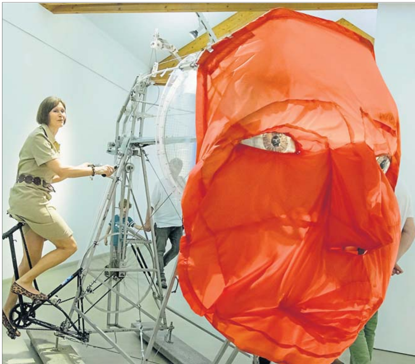
Bei der Ausstellung „KunstSpieleKunst“ fallen als erstes die Mitspielobjekte wie diese Maske auf.

Das sensationellste Kunstwerk ist zweifellos der gigantische atmende Zylinderballon „transForm“ in der großen Halle: Mal hängt die silbrige Hülle halbschlaff von der Decke, dann bläst sie sich parallel zum Dachbalken wieder auf: Es wechseln Prallheit und Erschlaffung, Fülle und Leere, Kraft und Schwäche: „So werden auch emotionale Situationen allegorisiert“, sagt Künstler Ambech über seine